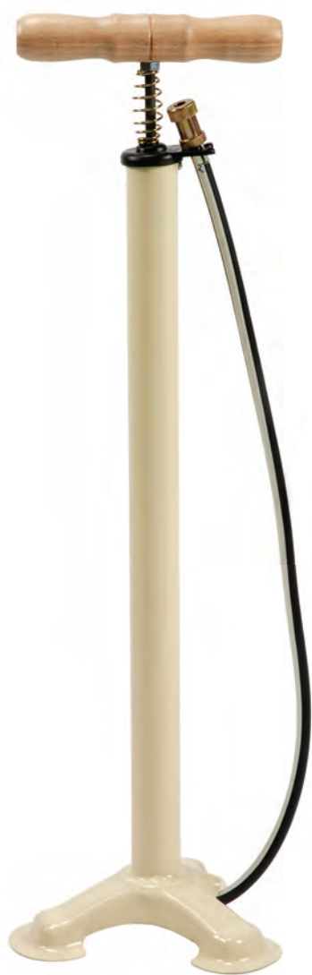
POM 06 P