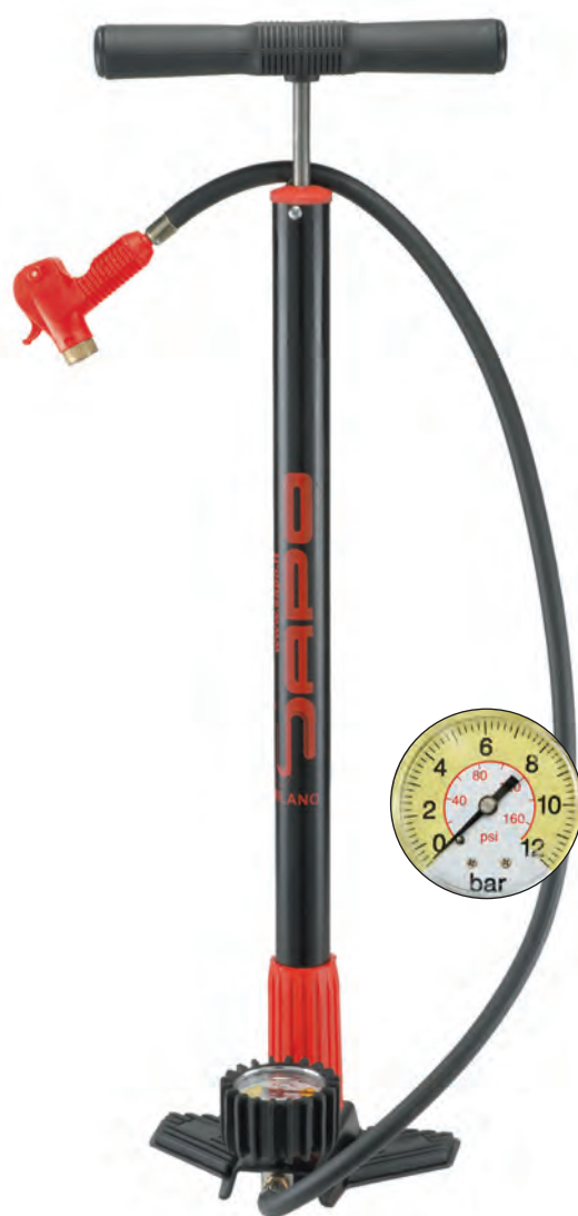
POM 50 N