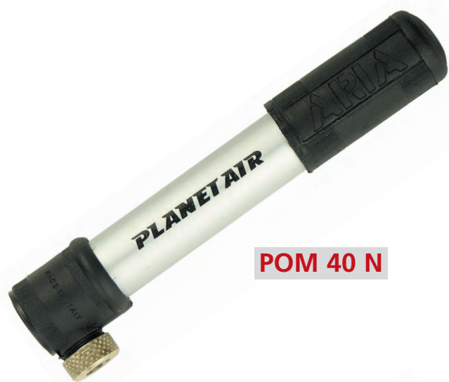
POM 40 N