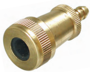
RA 01 P