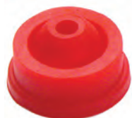
GO 01 R