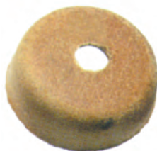
CU 01 33