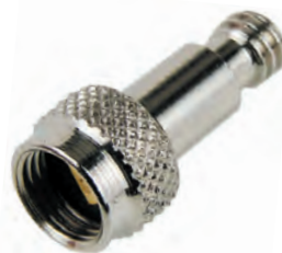
RA 38 CON VALVOLINA