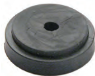
GO 01 N