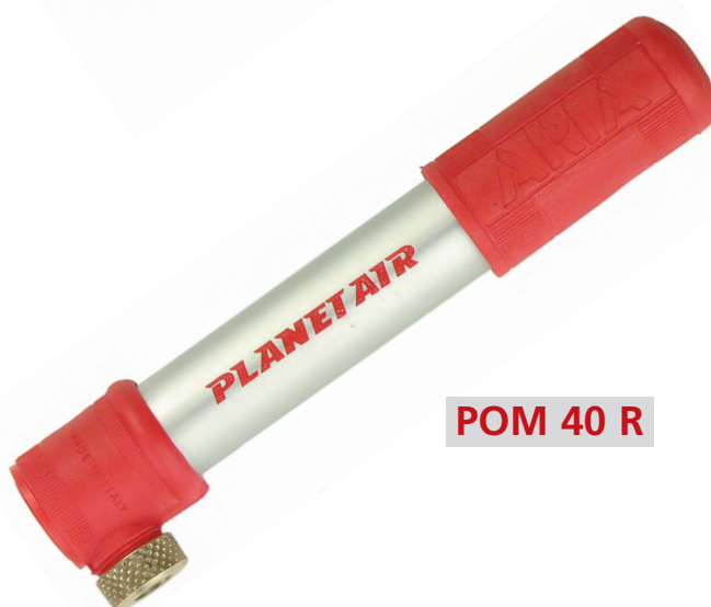
POM 40 R