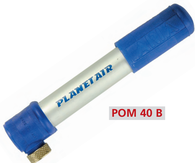
POM 40 B