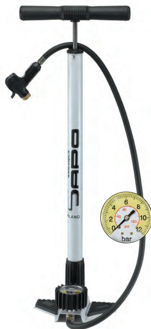
POM 50 B