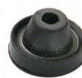
GO 02 N