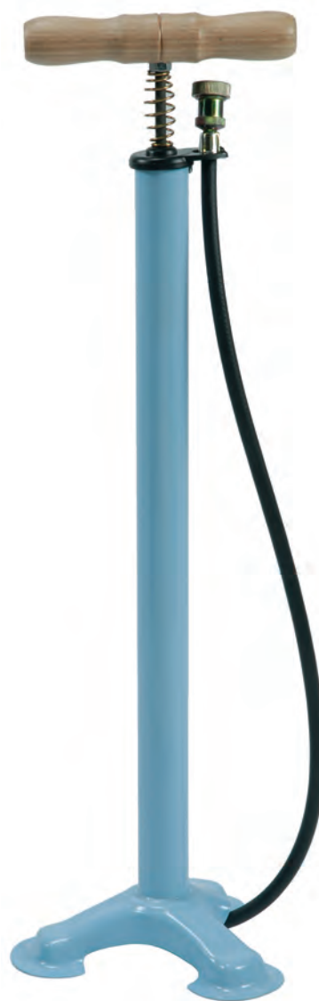
POM 06 A