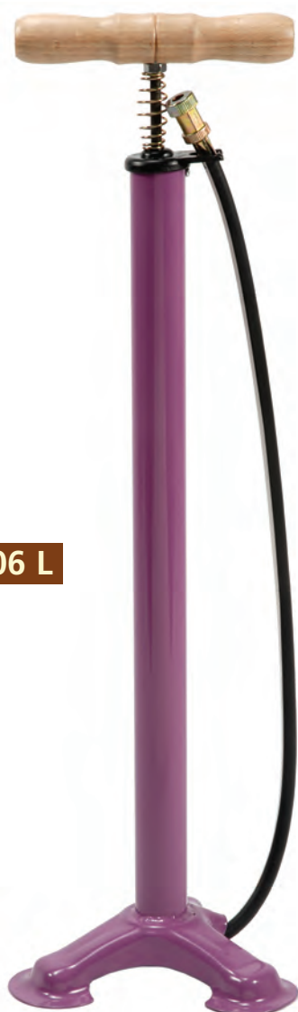
POM 06 L