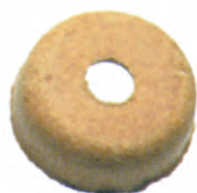
CU 01 28