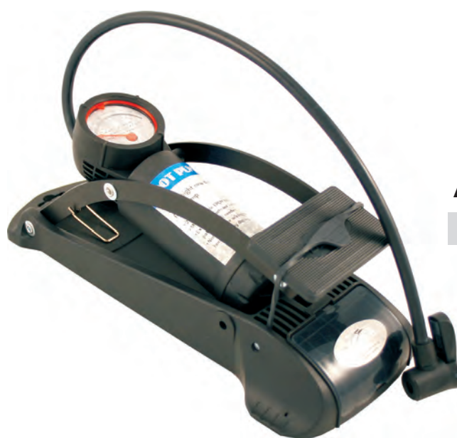
A PEDALE POM 44