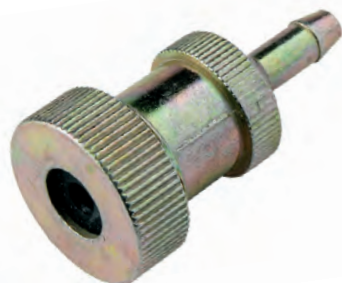
RA 01 G