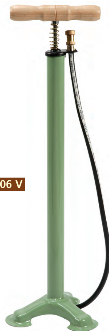
POM 06 V