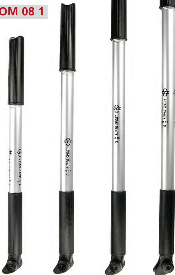
POM 08 1