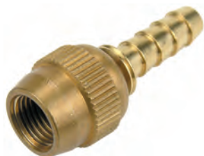
RA 39 GIREVOLE