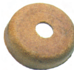
CU 01 38