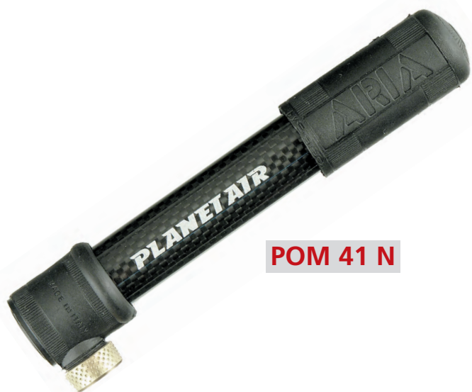
POM 41 N