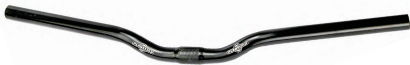
MA 12 N