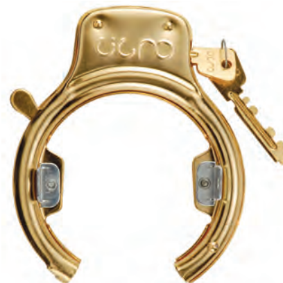
LU 25 O