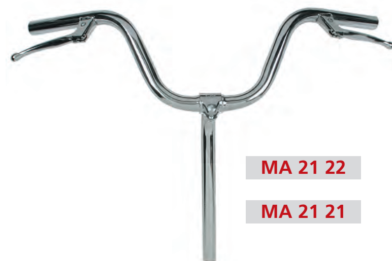
MA 21 22