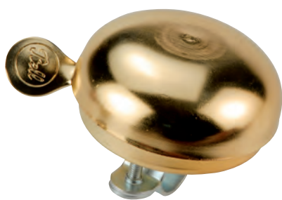
CAM 66 O