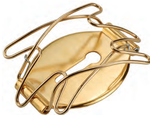
POR 26 O