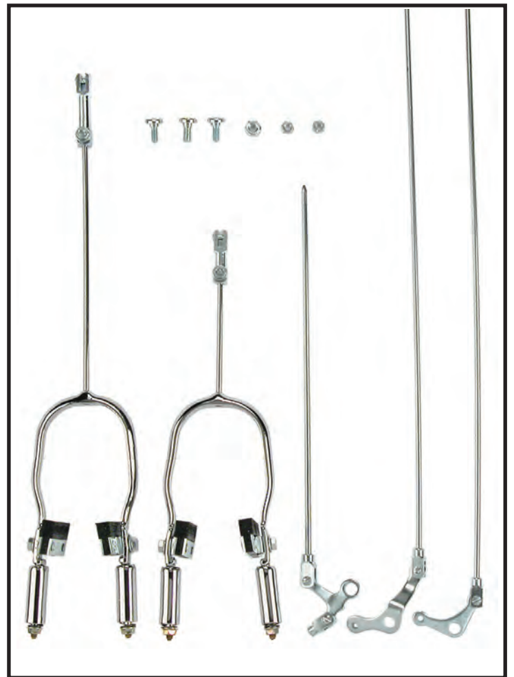
FR 11 P