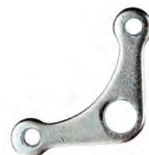
RI 10 A