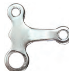
RI 10 T