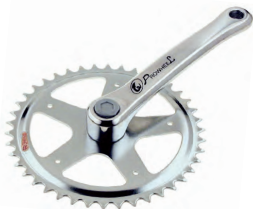
GU 02 C