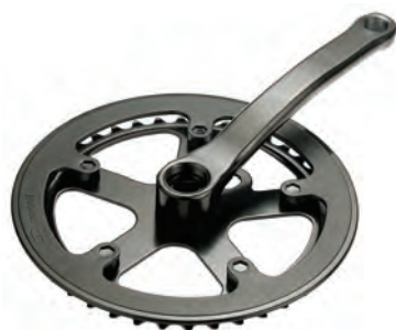
GU 17 150