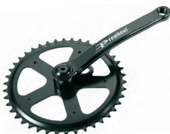
GU 02 N