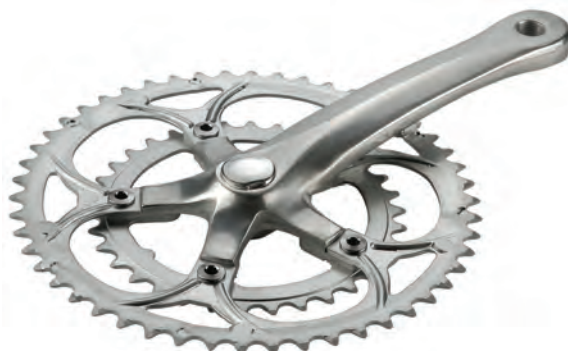
GU 22 COMPACT