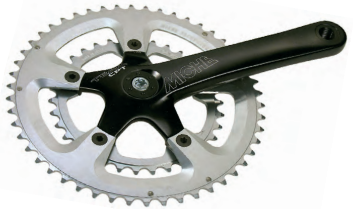
GU 33 170