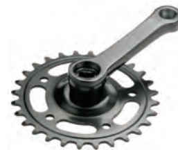
GU 17 90