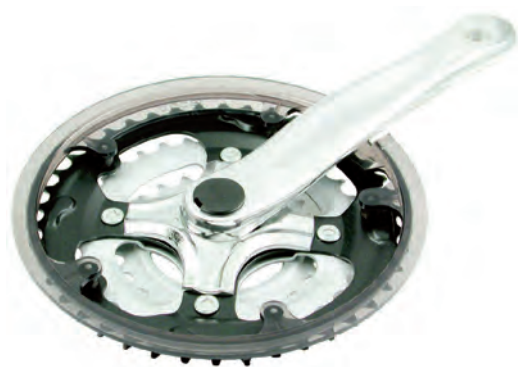
GU 18 S