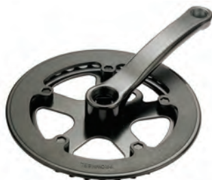
GU 17 130