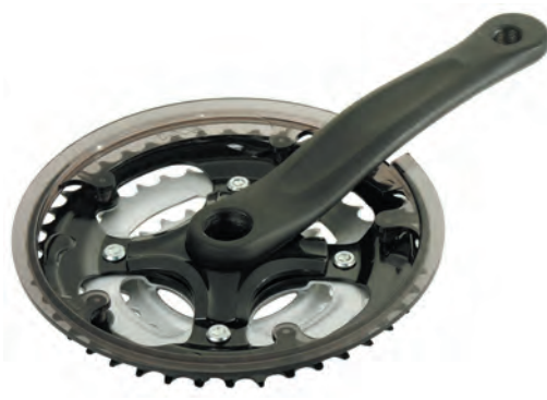
GU 18 N