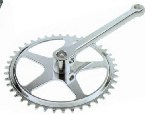
GU 01 42