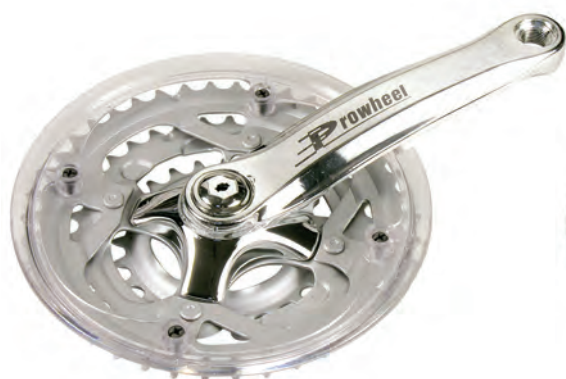
GU 04 C