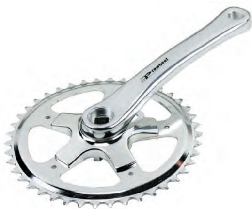
GU 03 42