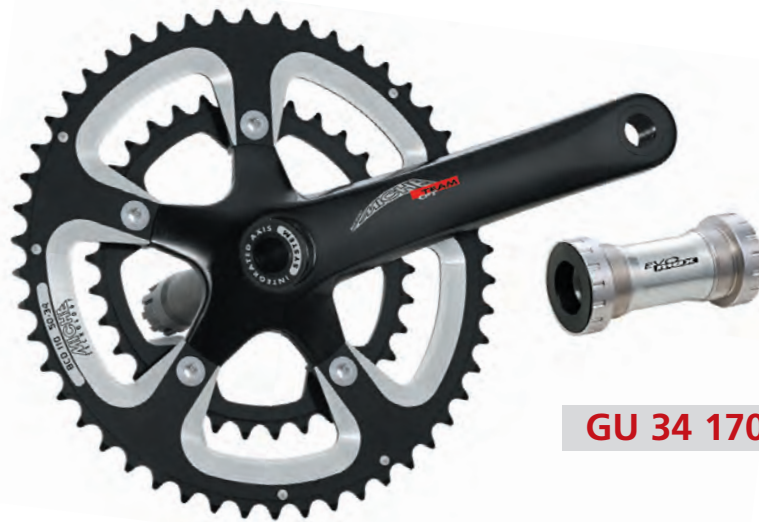
GU 34 170