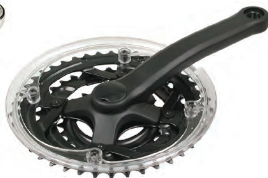
GU 04 N