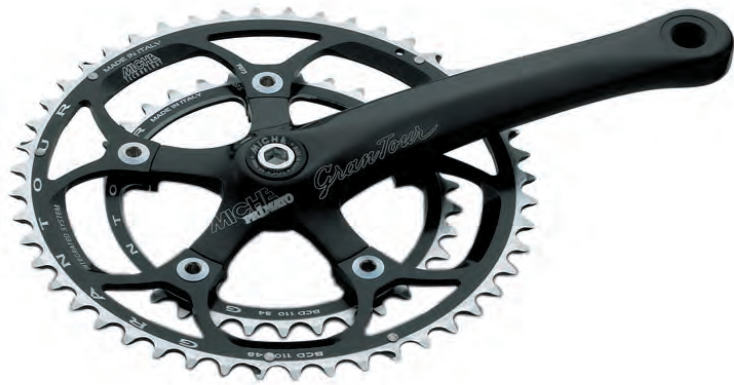
GU 35 170