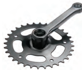
GU 17 105